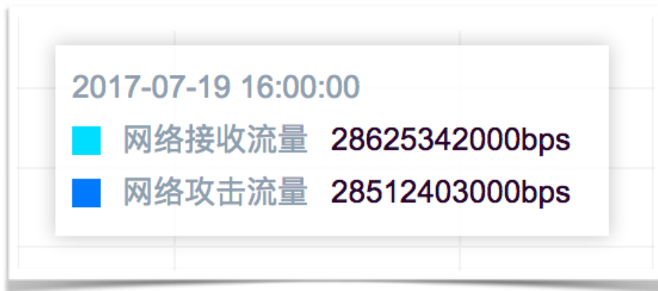
链信某日受到的单小时DDOS攻击峰值

然而事实证明我们有信心也有能力确保链信平台的稳定运营和持续发展。在链信技术团队的努力下，网站和相关服务有效地抵御了这样的威胁和攻击。