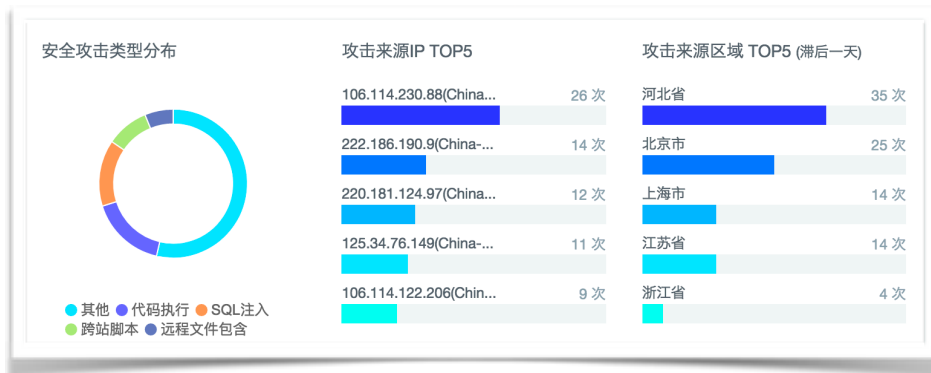
黑色产业对链信的“每日日常关照”

说，我们对黑产行业对我们地关注与照顾“深表惶恐”。此外各类常态性地跨站脚本、代码注入等传统非传统的攻击方式更是数不胜数。